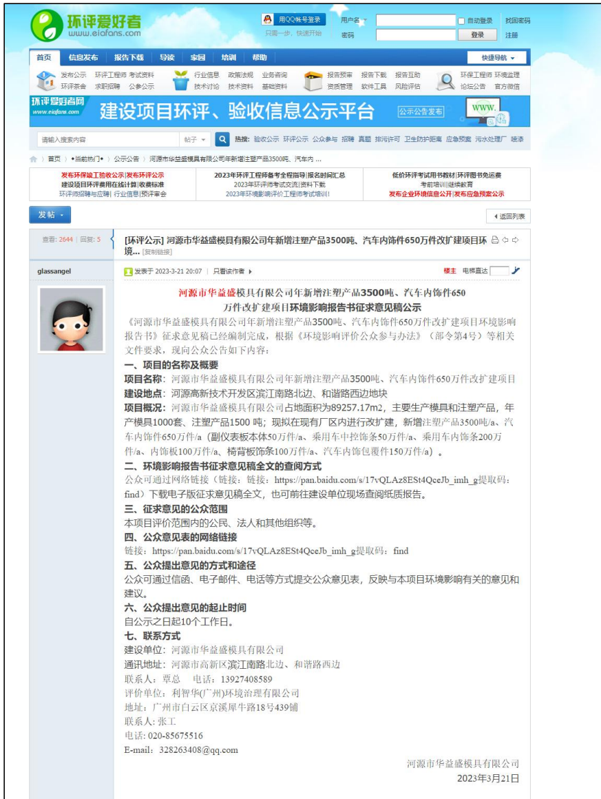
图 4.2-1 征求意见稿网上公示截图