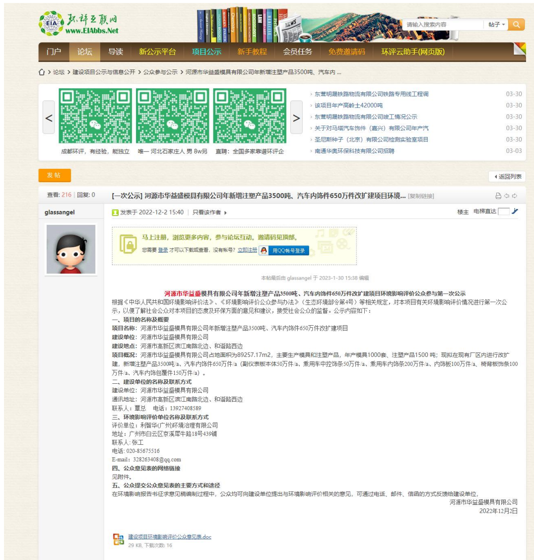
图 3.2-1 项目第一次网上公示截图

本项目首次环境影响评价信息公开方式采取网络方式，于2022年12月2日在环评互联网论坛首次公开环境影响评价信息情况，公示网址如下： http://www.eiabbs.net/forum.php?mod=viewthread&tid=578659&highlight=%BA%D3%D4%B4%CA%D0%BB%AA%D2%E6%CA%A2 ，公示截图见图3.2-1。