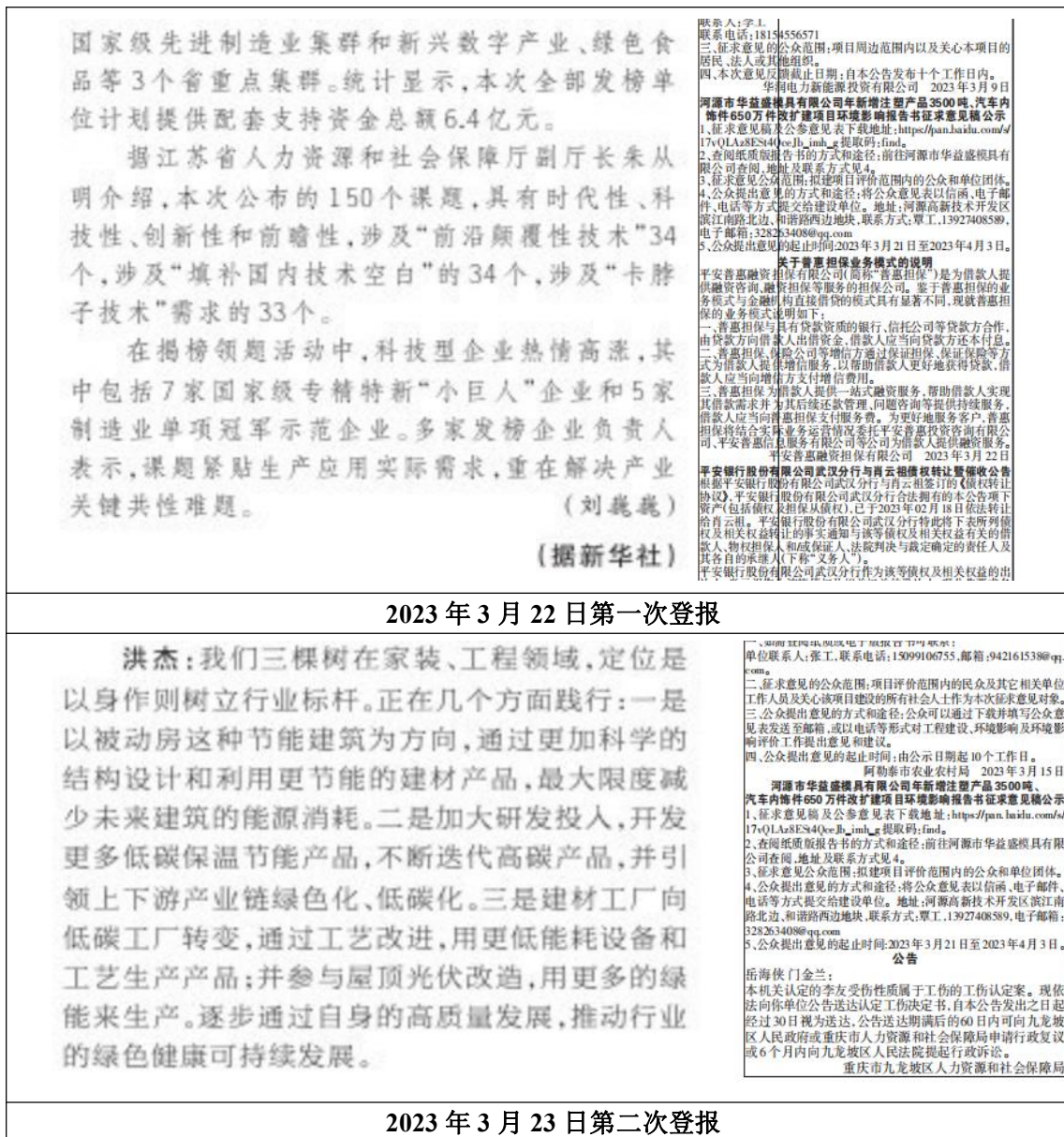
图 4.2-2 征求意见稿登报截图